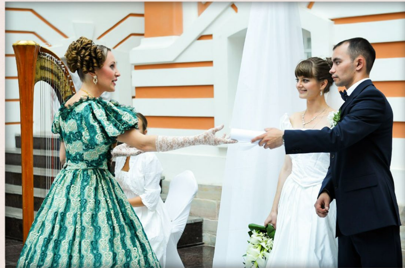
Эпоха А.С. Пушкина

Меняя стиль, сохраняем суть: сочетание священными узами брака двух любящих людей.