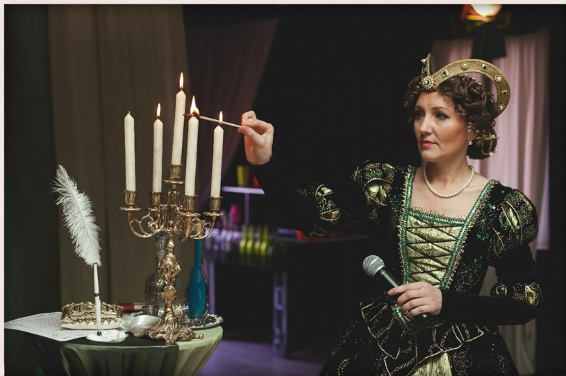
Эпоха влюблённого Шекспира

Путешествие во времени возможно?! Да! Во время свадебной церемонии.